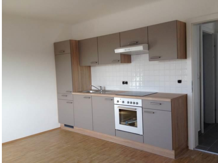
Wohnraum mit Küchenblock